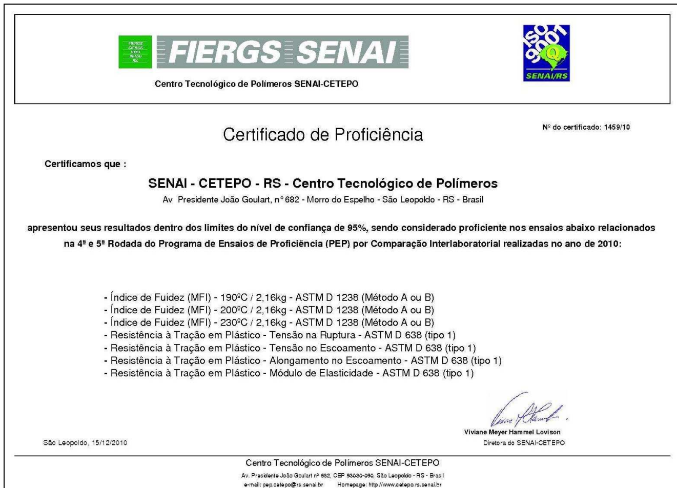
Figura 4: Certificado de Proficiência

O Certificado de Proficiente é fornecido anualmente somente aos laboratórios/empresas que participaram nas duas rodadas do corrente ano. Neste certificado são listados os ensaios em que o participante apresentou, nas duas rodadas anuais, seus resultados dentro do limite de 95% de confiança. Para participantes com mais de um equipamento inscrito no mesmo ensaio, o certificado de proficiência apresenta o código dos equipamentos que apresentaram desempenho satisfatório nas rodadas.