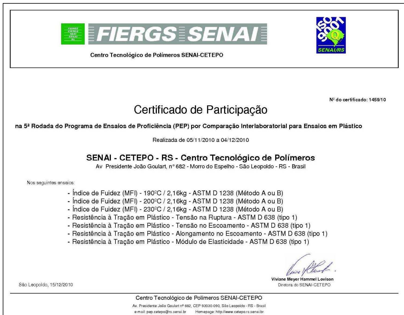
Figura 3: Certificado de Participação

O Certificado de Participação é fornecido ao final de cada rodada a todos os participantes. Neste certificado são indicados todos os ensaios que o laboratório/empresa participou independentemente do seu desempenho na rodada.